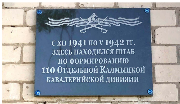
Фото 1. Мемориальная доска на бывшем здании штаба 110-й кавалерийской дивизии, с. Малые Дербеты