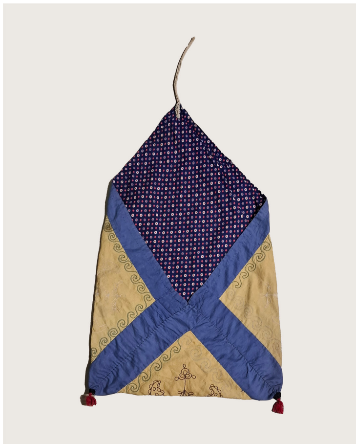
Фото 4. Мукса – сумка, сшитая в технике лоскутного шитья, украшенная вышивкой. Экспонат Курмановского музея-кабинета Аргаяшского района Челябинской области.

В традиционной культуре многих народов лоскуты выступали в качестве подарков-подношений для задабривания духов-хозяев, высших сил, служили важным атрибутом при общении с невидимым ми-