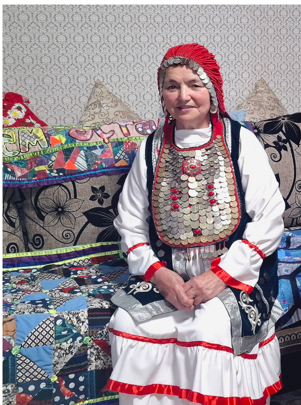
Фото 1. Интерьер современного деревенского дома, украшенный лоскутными изделиями. Альшеевский район Республики Башкортостан. Фото А. И. Баязитовой, 2024 г. [Photo 1. Present-day rural home interior with patchwork decorations. Photo by A. Baiazitova. 2024]

У башкир встречаются текстильные изделия, изготовленные путем сочетания способов лоскутного шитья и аппликации. Смешанная техника позволяла создавать сложные композиции, наделенные определенным смыслом. Использование аппликации, наиболее древнего вида прикладного искусства башкир, связано с культурой тюрко-монгольских кочевников, о чем свидетельствует широкое распространение ее в декоративном искусстве современных народов Южной Сибири, Алтая, Средней Азии