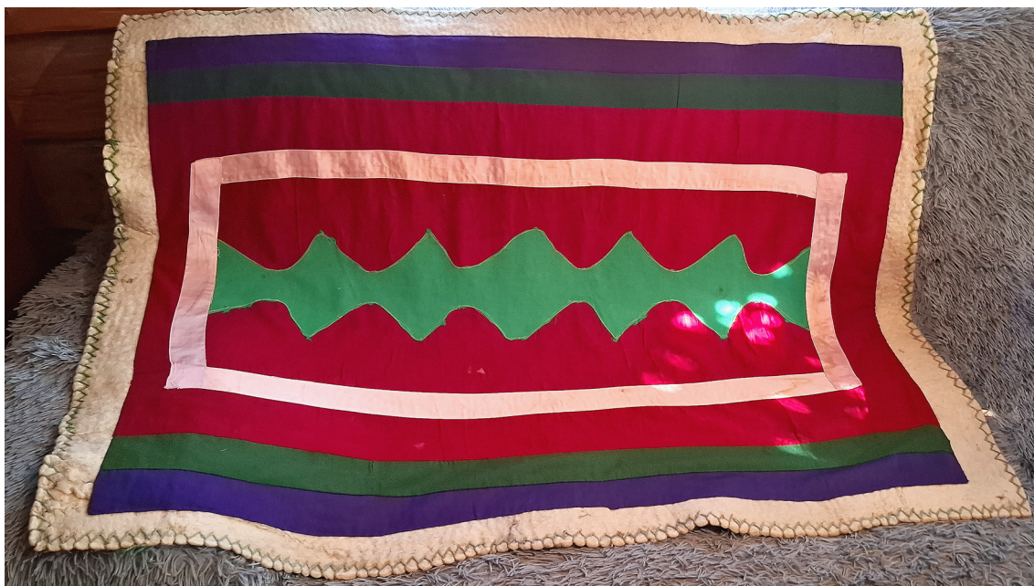
Фото 3. Сергетыш, изготовленный к свадьбе (1990-е гг.). Баймакский район Республики Башкортостан. Фото А. И. Баязитовой, 2024 г.

Лоскутья применялись при шитье и декорировании одежды. В прошлом, например, башкирки под платьем носили нагрудную повязку ( түшелдерек , түшлек , күкрәкә ), которую изготавливали из прямоугольного куска ткани с загнутыми верхними углами. К углам изделия пришивались завязки, которые фиксировались на шее и спине, обеспечивая удобную посадку изделия. Центральная часть повязки украшалась лоскутными полосками, которые заранее сшивались между собой в единое целое, а затем эта композиция нашивалась на основное полотно. Встречаются также изделия, украшенные вышивкой. По данным информантов, некоторые рукодельницы с правой стороны изделия делали карман для хранения денег. Этот предмет одежды служил подарком во время свадебной обрядности. Информанты отмечают, что к свадебному торжеству некоторые невесты готовили более десяти түшелдерек для женщин семьи жениха. О значении данного элемента одеж-